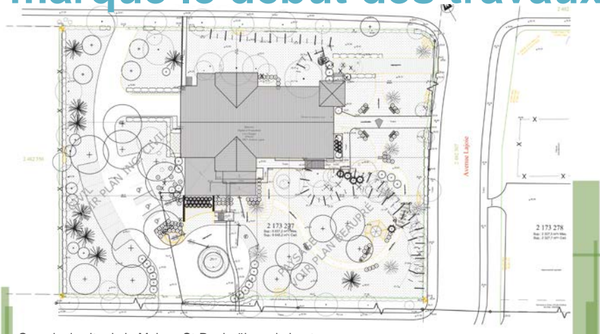
Croquis du site de la Maison St-Raphaël, vu de haut

LA GÉNÉROSITÉ DE NOS DONATEURS À CE JOUR NOUS AURA PERMIS DE FRANCHIR LE CAP DES 50 % DE NOTRE CAMPAGNE MAJEURE DE FINANCEMENT DE 10 M$.